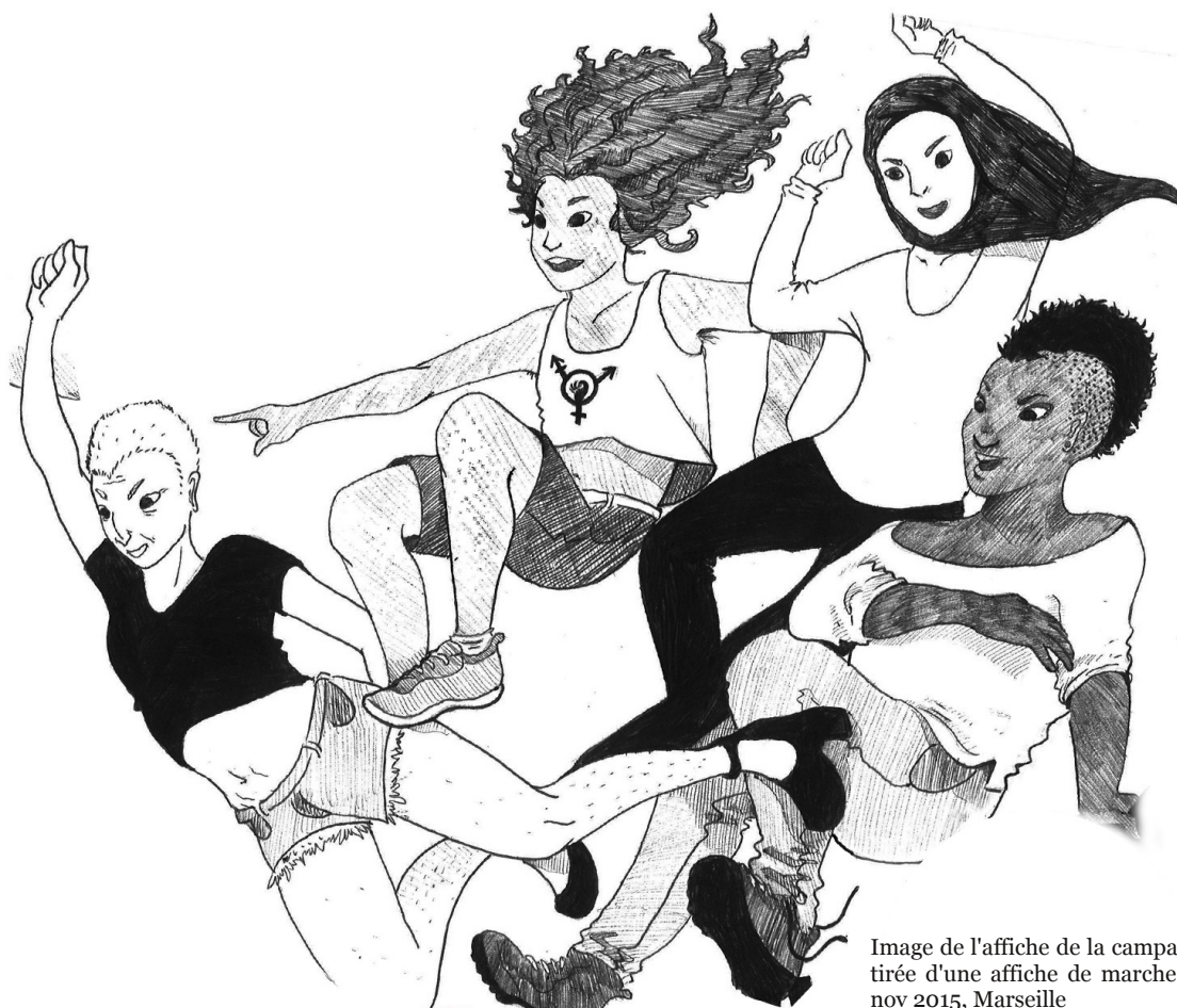
Image de l'affiche de la campagne transphobie, tirée d'une affiche de marche de nuit, nov 2015, Marseille

Le rôle des syndicats est ici d'informer et d'accompagner les étudiant.e.s dans leurs démarches individuelles, mais aussi de participer aux négociations avec la direction pour obtenir des procédures les plus simples et unifiées possibles. Au mieux, une modification des systèmes informatiques pour avoir une solution simple pour les étudiant.e.s, respectant leur vie privée et adaptable à leurs besoins, a minima l'engagement de la direction d'accepter les modifications de prénom et de civilité sur simple demande, avec ses corollaires pratiques : réédition gratuite de la carte d'étudiant.e, nouvelle photo, modification de l'adresse mail... Dans tous les cas, ces discussions doivent être dirigées par les revendications des étudiant.e.s trans de l'université en question, qui connaissent les subtilités du contexte local et leurs besoins.